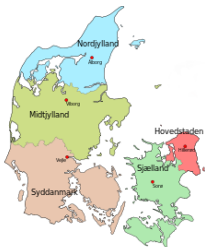
Figur 1 Flisforsyningsområde

Haderup Skovservice's forsyningsområde er danske skove, læhegn, naturområder og bynære bevoksning, hvor flisforsyningsområdet dækker hele Danmark, dog hovedsageligt Midtjylland.